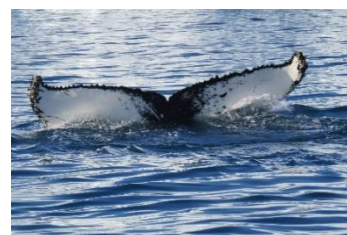
Pukkelhval ved Kangia