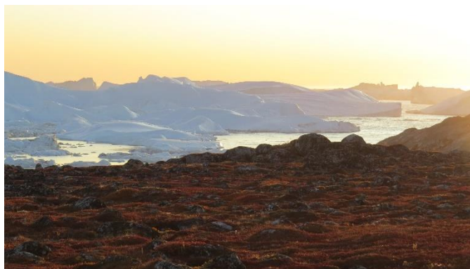
Isfjorden ved aftensol

Er man ikke til de lange ture, så er der mange muligheder for vandretur rundt i byen med museumsbesøg og gode afmærkede ture til bl.a. Kællingekløften med direkte kig ned til Isfjorden Kangia og måske være vidne til et kælvende isbjerg. Her kommer man også forbi det nye moderne Isfjordscenter med såvel kultur- som naturudstillinger.