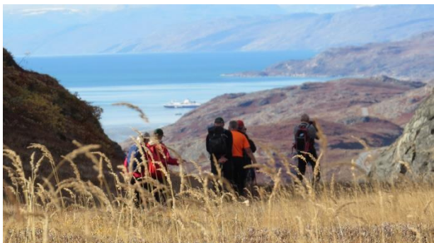
Vandretur på Køkkenfjeldet

Efter indlogering, briefing/velkomst og frokost er dagen til fri rådighed. Den første vandretur i den Grønlandske natur venter. Det kan være en tur op på Køkkenfjeldet eller ned til Fossilsletten neden for vandrehjemmet for at lede efter fossiler.