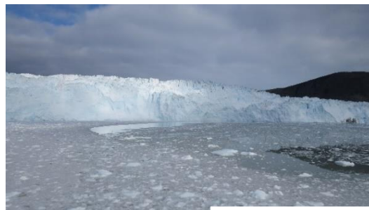
Fronten af Eqi glecheren

Som tilkøb til rejsen er det muligt at komme på en halvdags sejltur til Isbræen Eqi, som kælder konstant, men ikke mere voldsomt, end man kan komme ganske tæt på med skibet og mærke dønningerne fra nedfaldet og høre de konstante brag og knagen fra isen. I turen er frokosten inkluderet