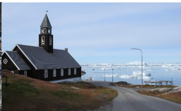
Zionskirken med udsigt over Diskobugten