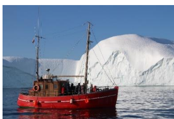
Turistbåd ved Kangia

Jeg skal anbefale at du deltager i en ca. 3 timers Hvalsafari med sejlads på Isfjorden Kangia. Her kommer vi tæt på de store mastodonter af is, som ligger og venter på at brække over eller blive skubbet over Isbræsbanken og ud i Diskobugten. Hvis vi er heldige, vil vi også kunne se en eller flere pukkelhvaler, som er hyppige gæster i området.