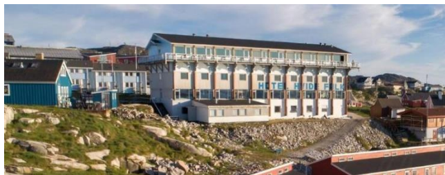
Hotel Hvide Falk

Vi overnatter på Hotel Hvide Falk i nyrenoverede værelser med udsigt over Diskobugten. Her er kun morgenmaden inkluderet i prisen. Ilulissat giver mange muligheder for at spise ”ude”. Men hotellet har en glimrende restaurant.