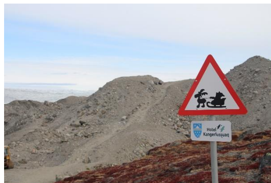
Her ender vejen ved Indlandsisen ved Pk.t 660

Der bliver en enkelt dag til fri rådighed. Hvis vejret arter sig, er der rige muligheder for vandreture på egen hånd, bl.a. op på toppen Sugar Loaf og til vandfaldet.