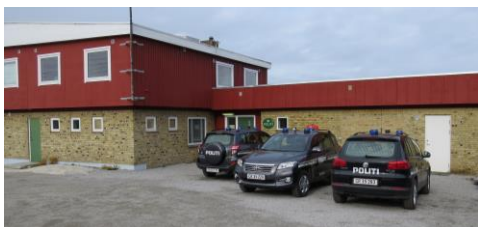
Politistationen i Ilulissat

Vi plejer at have en aftale med politiet i Ilulissat om et besøg på stationen. Her får vi en orientering om deres helt specielle arbejde under de anderledes forhold. Hvis vi er heldige vil vi også kunne besøge en af de helt nye hurtiggående politifartøjer.