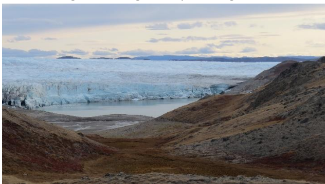
Isrand-søen ved Punkt 660

Programmet er endnu ikke fastlagt, men i rejsen er inkluderet tur i specialbus til Indlandsisen ved Pkt. 660 – ca. 35 km fra Kangerlussuaq. Her kommer vi ud at gå på isen. Det er storslået og enormt fascinerende at stå og se på den store uendelighed. Vi kommer også tæt på den meget velkendte Isrand-sø, som flere gange har tømt sig for vand ganske pludseligt.