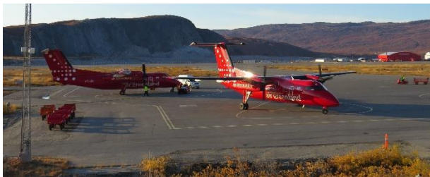
Dash 8 klar til flyvning til Ilulissat

Efter 3 nætter i Kangerlussuaq flyver vi de ca. 250 km mod nord til Ilulissat – som betyder ”Isbjerg”. Det er også isbjergene, som gør byen helt speciel som nabo til verdens største bræ, der kom på Unescos Verdensarvsliste i 2004.