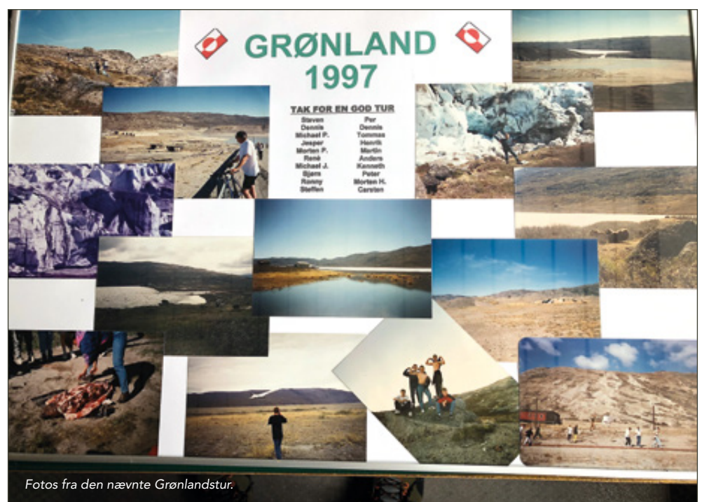
Fotos fra den nævnte Grønlandstur.

I forbindelse med IPA Esbjergs samarbejde med andre myndigheder blev vi opfordret til at deltage i genopdragelse af grupper af unge. Vi havde dog den opfattelse at andre unge også skulle have mulighederne, hvorfor vi blandede grupperne vi tog med