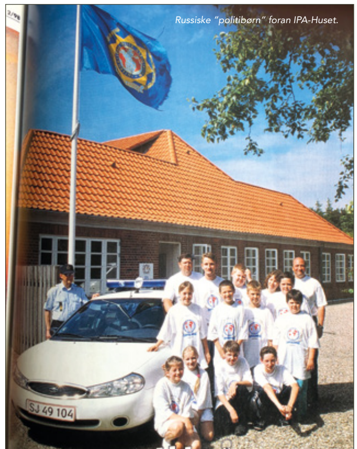
Russiske "politibørn" foran IPA-Huset.