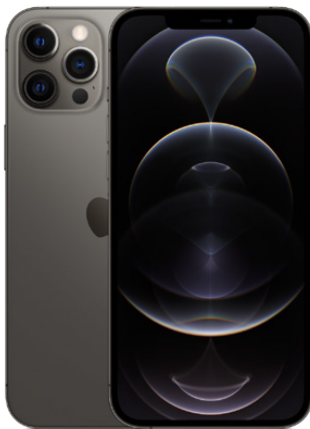
🍏 iPhone 12 Pro Max

Apple iPhone 12 Pro max 128GB: 5.450 kr.