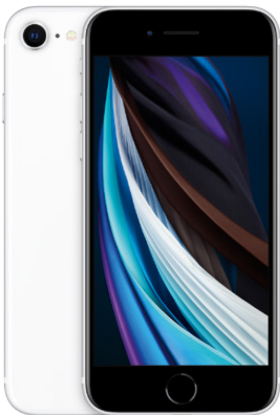
🍏 iPhone SE